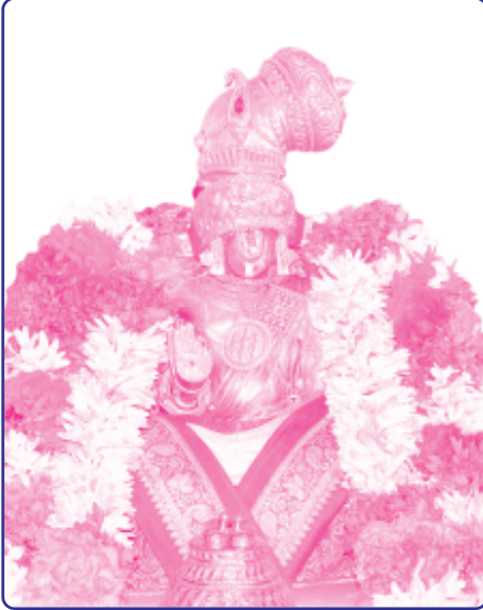
தமிழ்மறை செய்த நம்மாழ்வார்

ஆழ்வார் எம்பெருமானார் ஜீயர் திருவடிகளே சரணம்